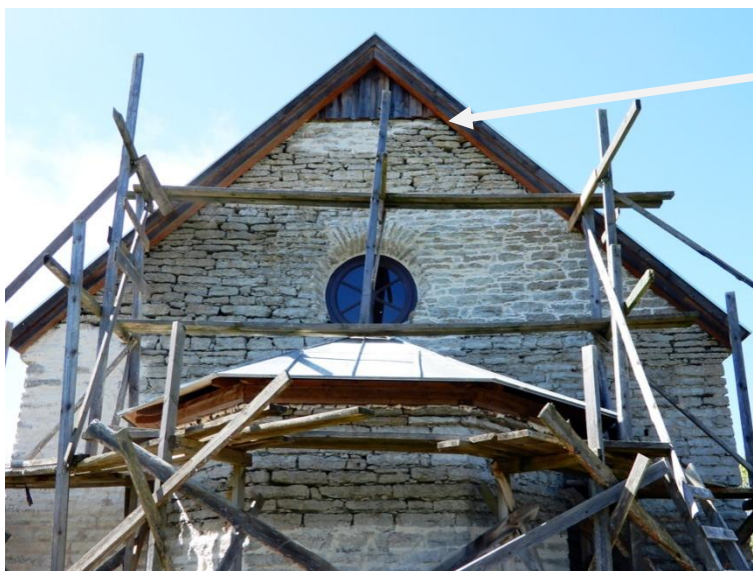
Hål i muren

Börja fogningsarbetet på östfasadens högsta punkt. Muren börjar ca 50 cm under spetsen. Vid murens norra kant finns ett hål som bör muras igen så att fåglar inte kan ta sig igenom.